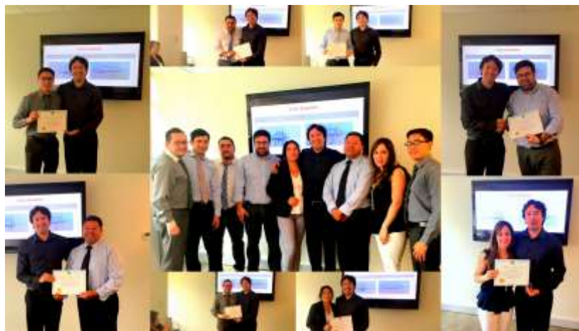
Profesor de Grafología aplicada a Selección de Personal y Pericia de Falsificaciones en Firmas para Empresas