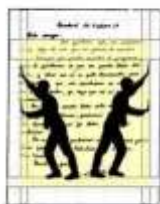
Márgenes y Tachaduras

Reconocer e interpretar los márgenes y tachaduras de la escritura.