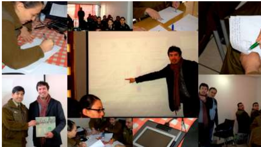
Docente en Taller "Grafología Científica y Pericia de Firmas Digitales Manuscritas" dictado a Peritos Documentales de Carabineros de Chile