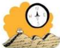
Ambiente General del escrito

Reconocer e interpretar los elementos del ambiente general del escrito