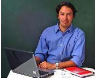
Psicólogo Universidad Diego Portales.